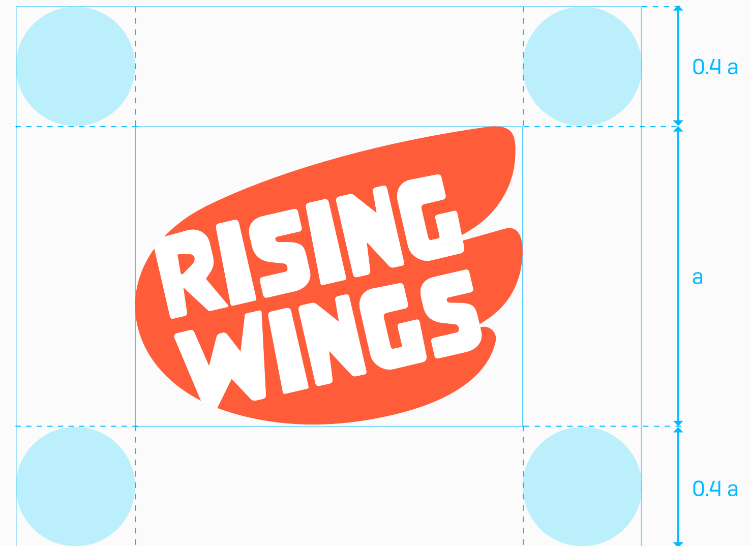
Primary Logo Clear Space