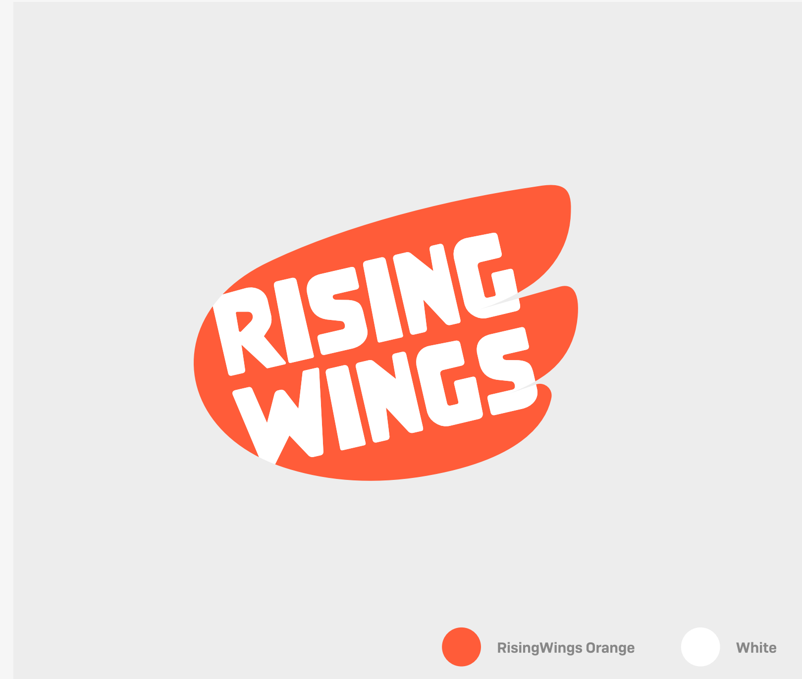
Two Colors Logo[Primary]